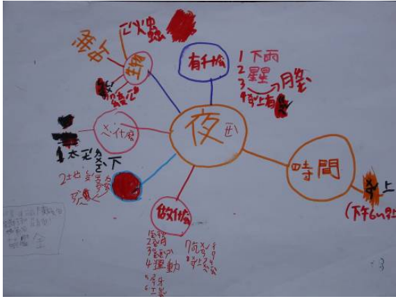
■ 「日與夜」單元前，請同學運用圖表做「夜的聯想」