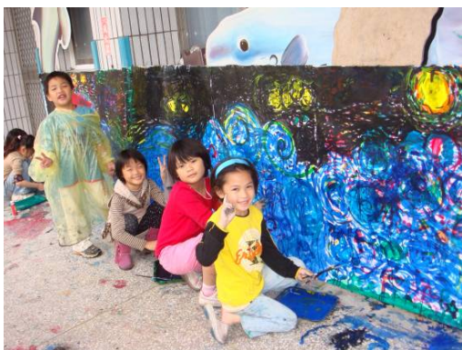
■ 嘿嘿~練習作品也完成囉~