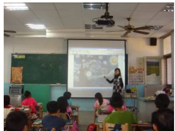
■ 介紹畫家梵谷特殊繪畫風格，請同學發表感覺和看法。