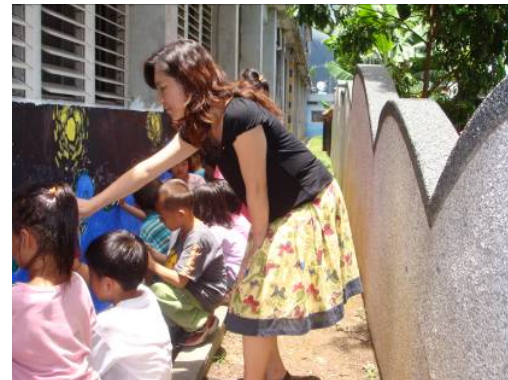
■ 接著，我們到牆壁去創作囉