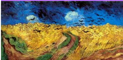
■ 運用教室單槍投影，介紹名畫家梵谷的生平