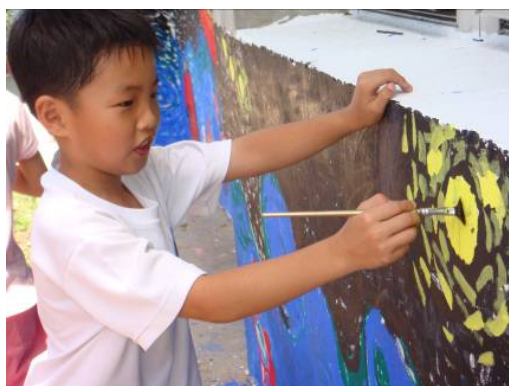
■ 就是這個光啦!月光加星光才夠~