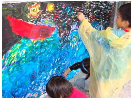
■ 練習快要完成了耶