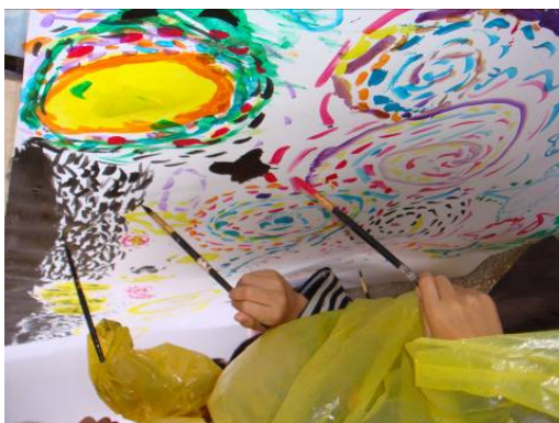
■ 穿起輕便雨衣，作壁畫練習的創作，可以避免衣服弄髒喔