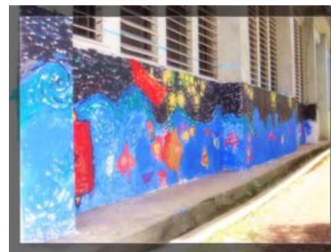
■ 這是完成後的全貌~就在我們學校的曼波魚館後面喔! 歡迎您到康樂國小來參觀~