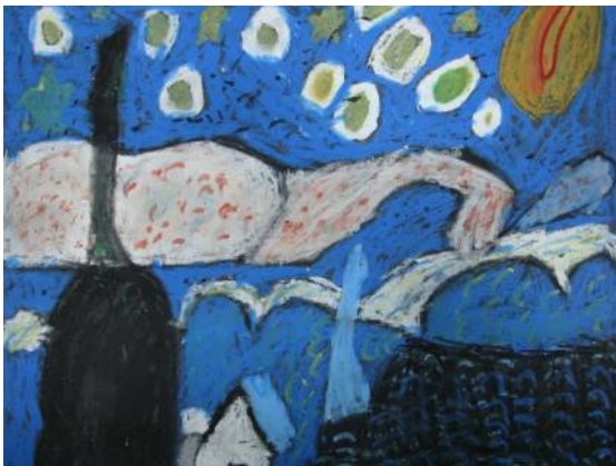
■ 運用砂紙和蠟筆仿作梵谷作品「星夜」